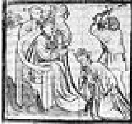
CLODIMIR (495 – 524)