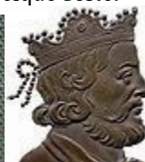
THIBERT 1er et CHILDBERT 1er (504-548) (497-558)

Son fils Thilbert premier lui succède, mais quand Thibaud, meurt de maladie, le royaume revient à CHILDEBERT premier, cadet des fils de Clovis puis à Clotaire premier, le benjamin.