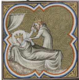
Chilperic étrangle Galswinthe,

Sigebert 1er hérite du royaume de Reims, c'est lui qui épousera la célèbre Brunehaut tandis que son frère cadet, Chilpéric qui épouse la sœur de cette dernière, Galswinthe dont l'assassinat en 568 entraînera une guerre entre les deux frères.