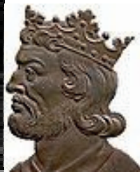
THIERRY 1er (485/490 – 534)

L'un était fils de Clothilde mais quand celui-ci est tué à la bataille de Vézeronce, Isère, contre les Burgondes, il est remplacé par Thierry, fils aîné de Clovis mais dont la mère n'était considérée que comme une épouse de second rang, une favorite, en quelque sorte.