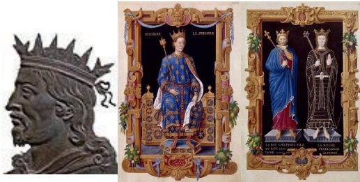
CARIBERT SIGEBERT et CHILPERIC (521-567) (535-575) (526-584)

Aîné des fils survivants de Clotaire premier, Caribert hérite du royaume de Paris, mais il est excommunié pour bigamie, il meurt sans descendance mâle, et voit son royaume partagé entre ses frères. Sigebert, Chilperic et Gontran.