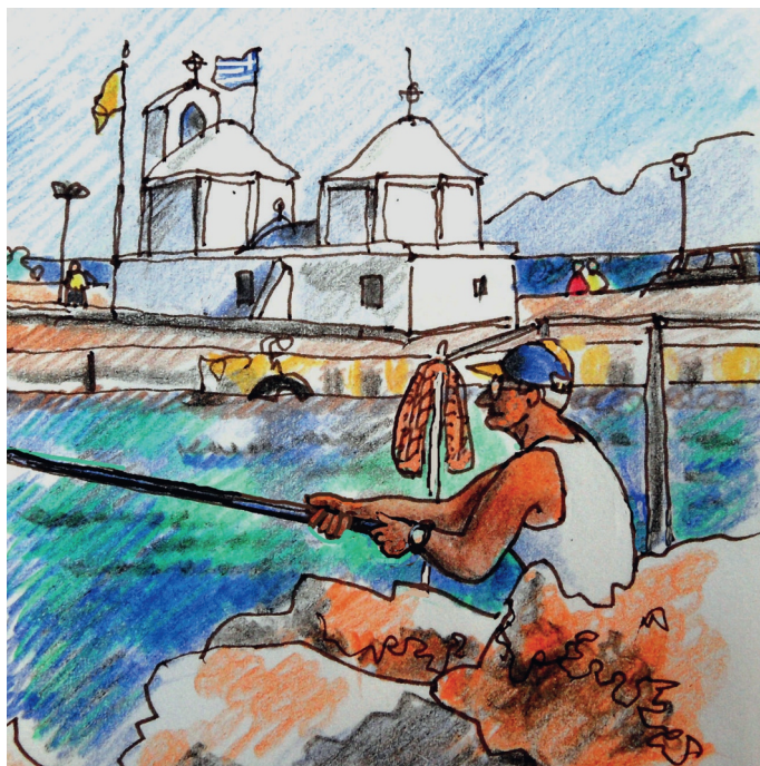
Le 9,9 h. Egine, un pêcheur