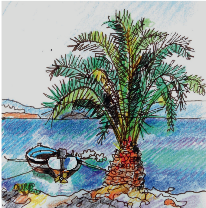
Le 12, 9 h. Egipte, un ananas marin ?