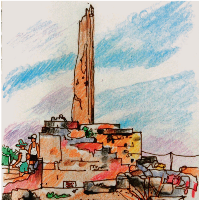
Le 14, 10 h. Egine, Kolonna