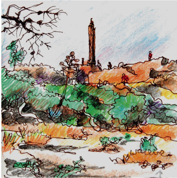
Le 4, 10 h 30. Egine, plage de Kolonna