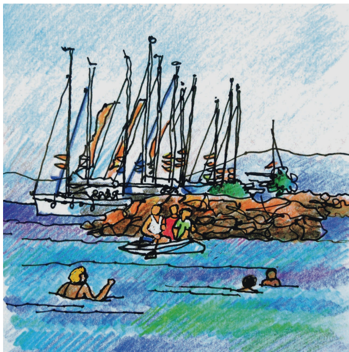
Le 7, 10 h. Egine, la régata au repos