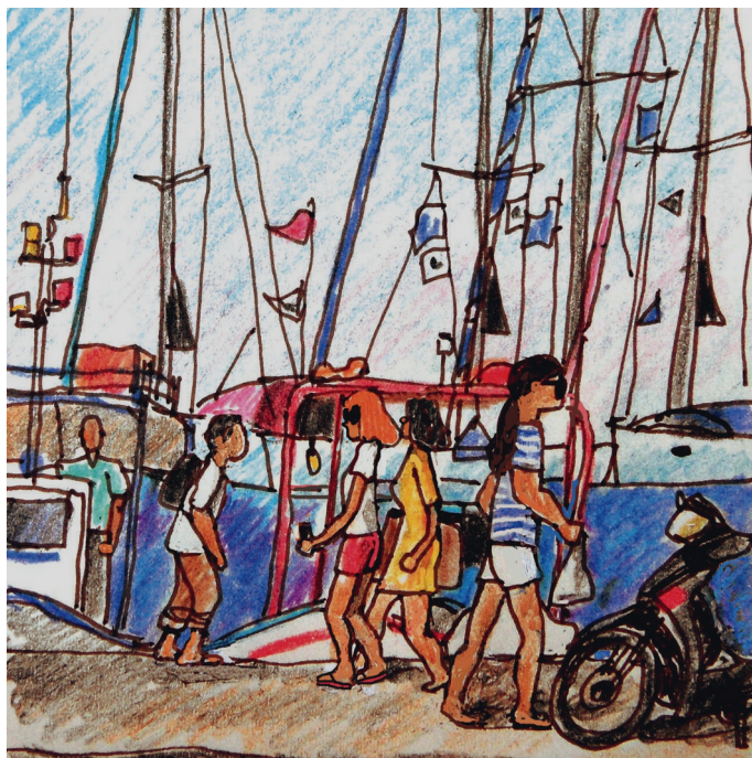
Le 2, 9 h. Egine, sur la paralia