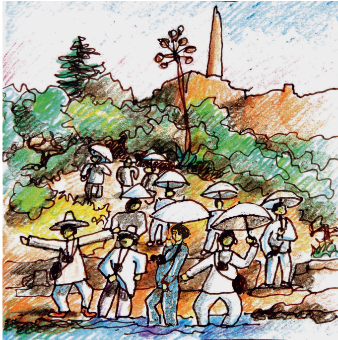
Le 4, 11 h. Eglise, plage de Kolonna, le bain des Chinois