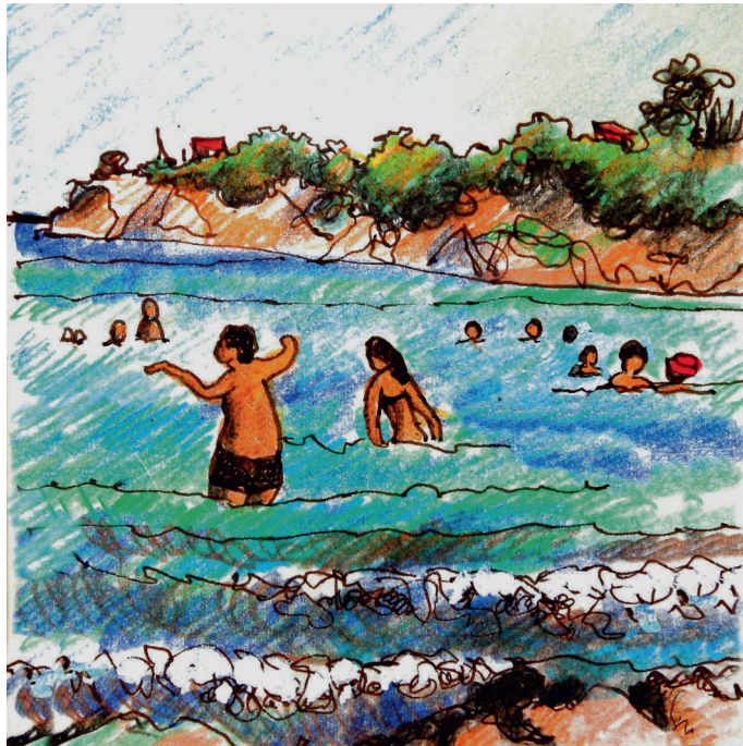
Le 5, 9 h 30. Egine, plage de Kolonna