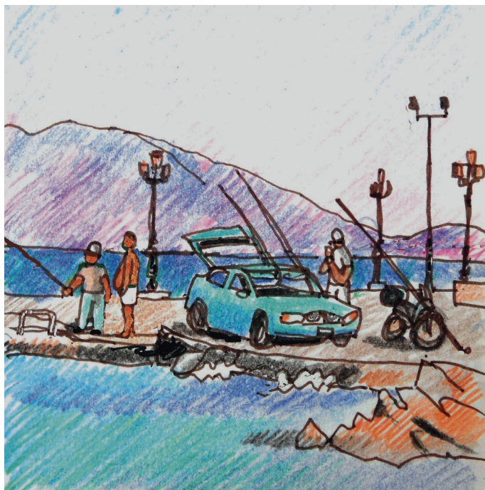
Le 11, 10 h. Égine. la pêche motorisée