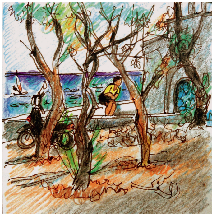
Le 8, 10 h. Chloé, méditation