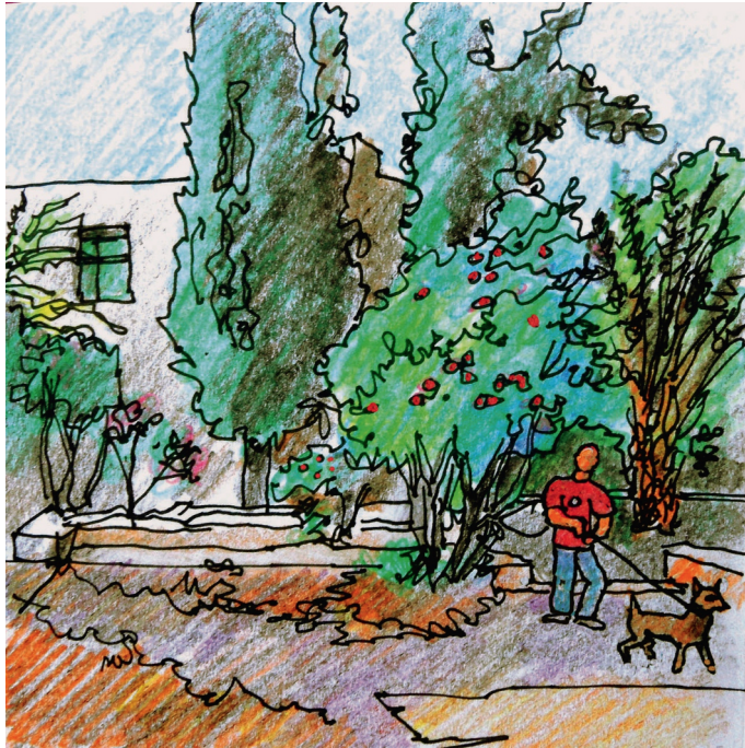
Le 7, 9 h. Eglise, à côté de la tour Markelou