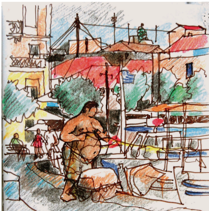
Le 15, 10 h., Eglise, Le tri des filets