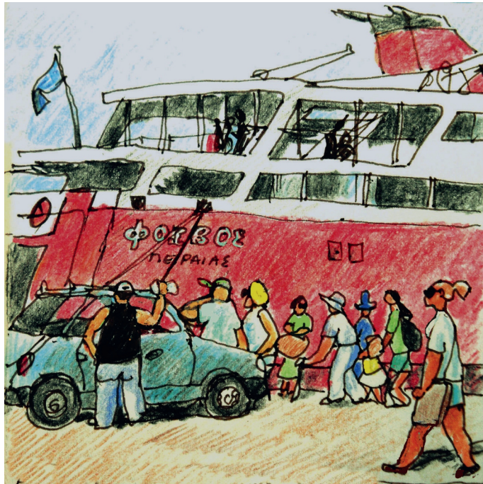
3 Ιουλίου. 9 πμ. Αίγινα, ο Φοίβος φτάνει 3. 9:00 am Aegina, the Phivos is arriving