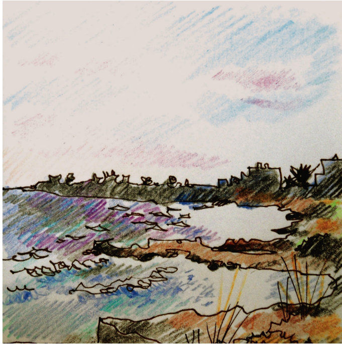
2 Ιουλίου. 8 πμ. Πλακάκια, τα κύματα 2. 8 am. Plakakia, the waves