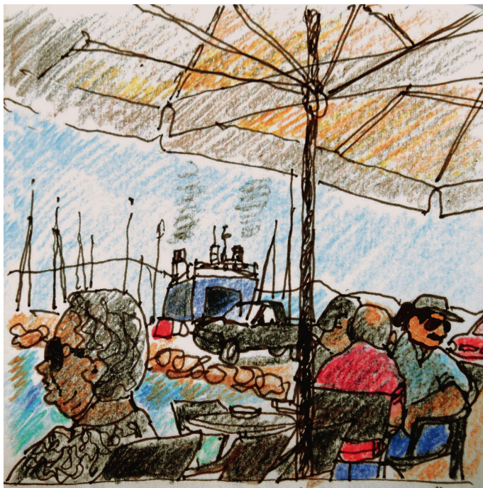
7 Ιουλίου. 10 πμ. Αίγινα, στο Θερμοπώλιον Παναγίτσα July 7. 10 am. Aegina, in Thermopolion Panagitsa