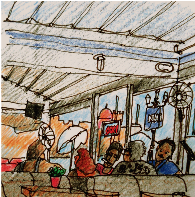
4 Ιουλίου. 8 πμ. Πλακάκια, απέναντι από το ξενοδοχείο Δανάη 3. 11:00 am. Plakakia, in front of Danae hotel