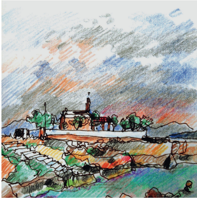
1 η Ιουλίου. 6 μμ. Πλακάκια, το μπάνιο μετά την καταιγίδα 1. 6:00 PM. Plakakia, swimming after the storm