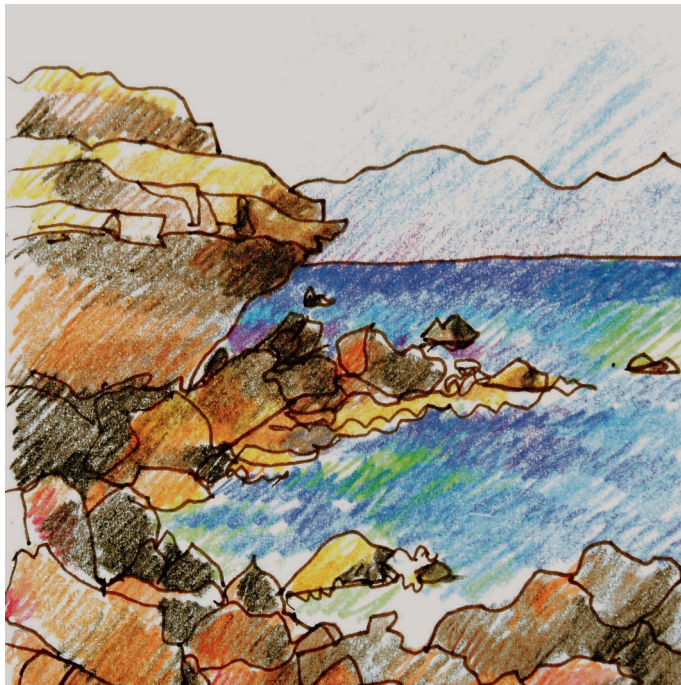
8 Ιουλίου. 10 πμ. Πλακάκια, η παραλία προς αριστερά του φάρου July 8th. 10 am. Plakakia, the beach to the left of the lighthouse