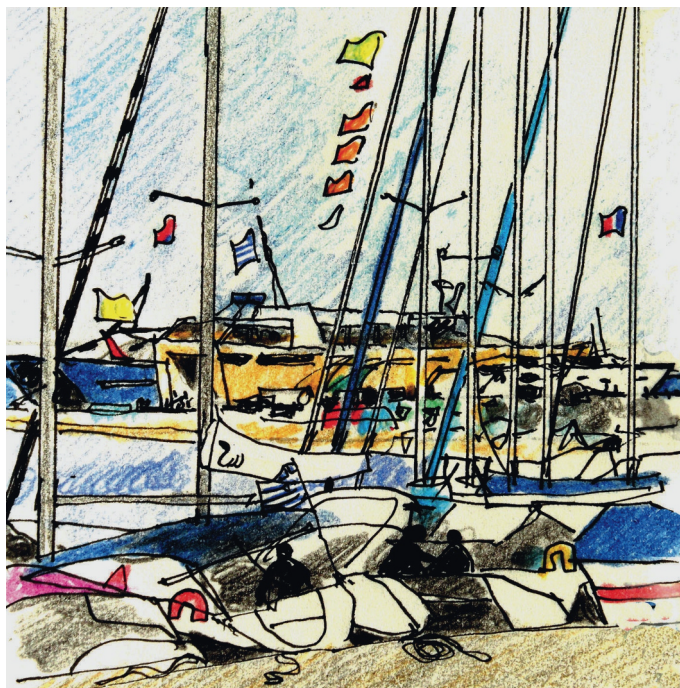
7 Ιουλίου. 11 πμ. Αίγινα, η παραλία July 7. 11 am. Aegina, paralia