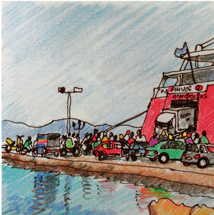
9 Ιουλίου. 9 πμ. Αίγινα, η άφιξη του Φοίβου July 9. 9:00 a.m.. Aegina, the arrival of Phoebus