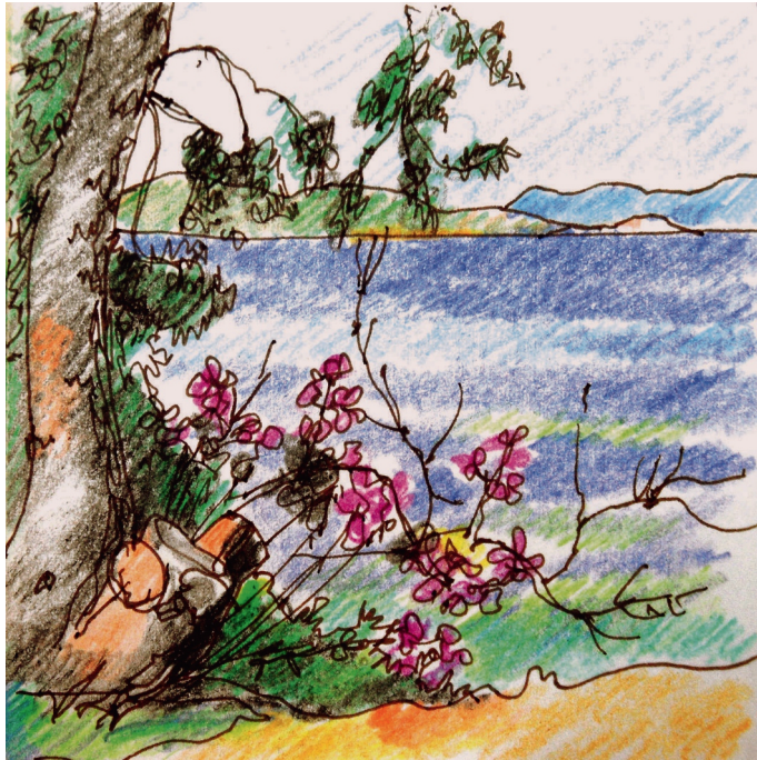
4 Ιουλίου. 8 πμ. Πλακάκια, απέναντι από το ξενοδοχείο Δανάη 3. 11:00 am. Plakakia, in front of Danae hotel