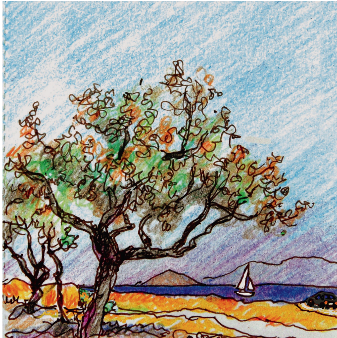
3 Σεπτεμβρίου, 10 πμ. Λιβάδι και Χλόη, το αρχαιολογικό χώρο 3, 10:00. Línadí Khlói, archéological site