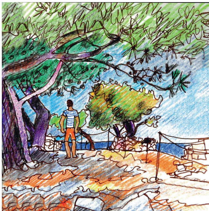
9 Σεπτεμβρίου, 11 πμ. Κολώνα, περπατήστε στον αρχαιολογικό χώρο 9, 11:00. Kolonna, walking in the archaeological site