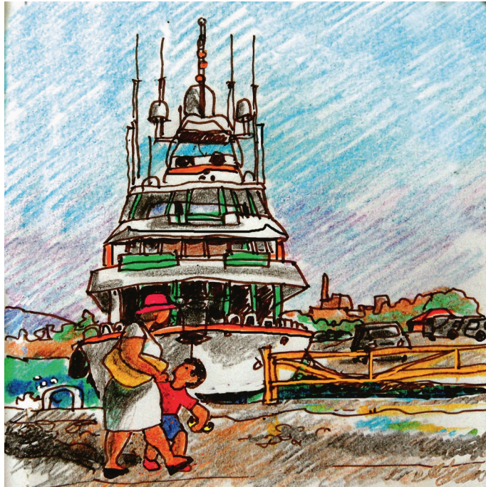
5 Σεπτεμβρίου 10 πμ. Αίγινα, 'Μαμά! Το πλοίο διαθέτει εννιά κεραίες ' 5, 10:00. Aegina, « Mam! The boat has five antennas? »