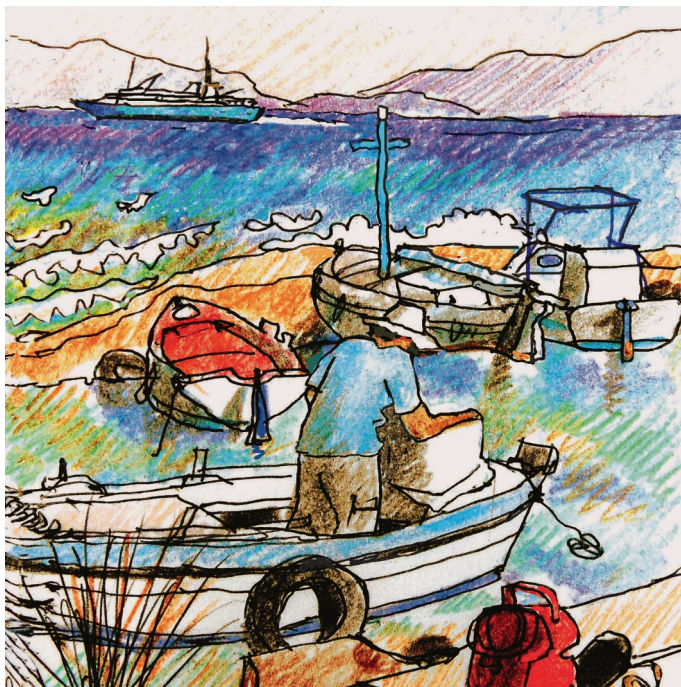
6 Σεπτεμβρίου, 9 πμ. πλακάκια, πρέπει να καλύπτει τη μηχανή για το χειμώνα , 9:00. Plakakia, preparing the engine for winter