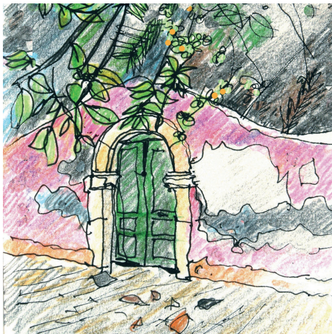
7 Σεπτεμβρίου, 12 πμ. Αίγινα, δροσερή σκιά 7 septembre, 12 h. Egine, ombre fraîche