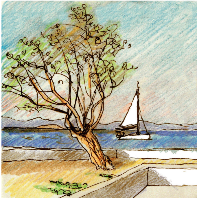
3, 11 πμ. ε, 11 h. Χλόη, ένα ιστιοφόρο 3, 11:00. Kloi, a sail