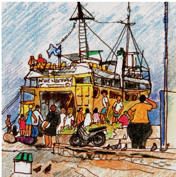
2 Σεπτεμβρίου 10 πμ. Αίγινα, Το πλοίο 'Αγίος Νεκταρίος' 2, 10:00. Aegina, Aghios Nektarios at dock