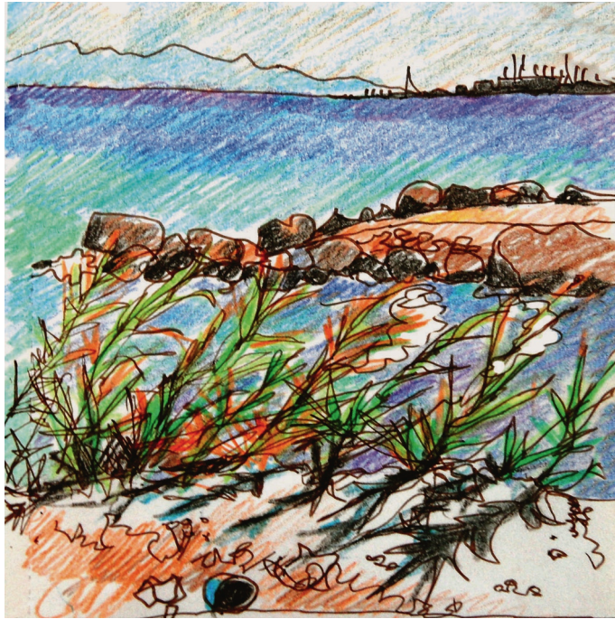
1η Σεπτεμβρίου. Χλόη, ο ανέμος στην παραλία September 1 th. Kloi, morning wind on the beach