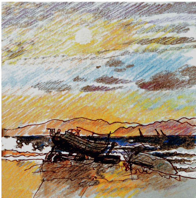
10 Σεπτεμβρίου, 10 πμ. πλακάκια, η παρατημένη βάρκα 10, 10:00. Plakakia, The abandoned boat