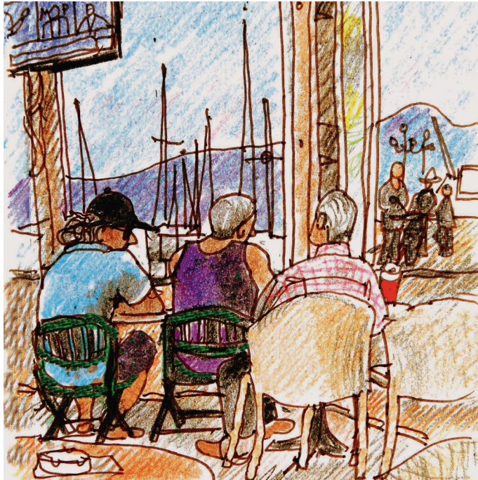
2, 9 πμ. στο Tropic's. Σχολιάσουν σχετικά με την παραίτηση του Τσίπρα 2 9:00. Aegina, Tropic's. Talking about Alexis Stípras