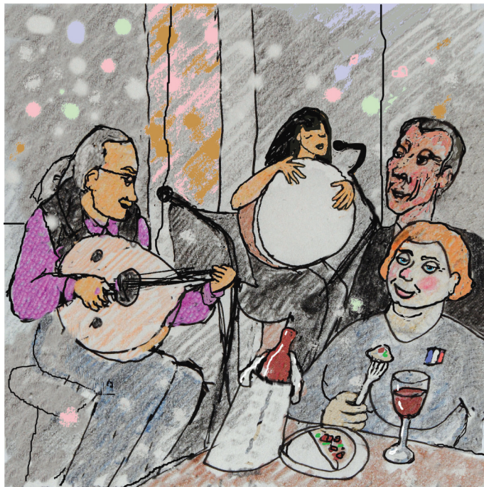
9 Σεπτεμβρίου, 12 μμ. Αίγινα, το βράδυ 9 september, 23 h. Aegina, at night