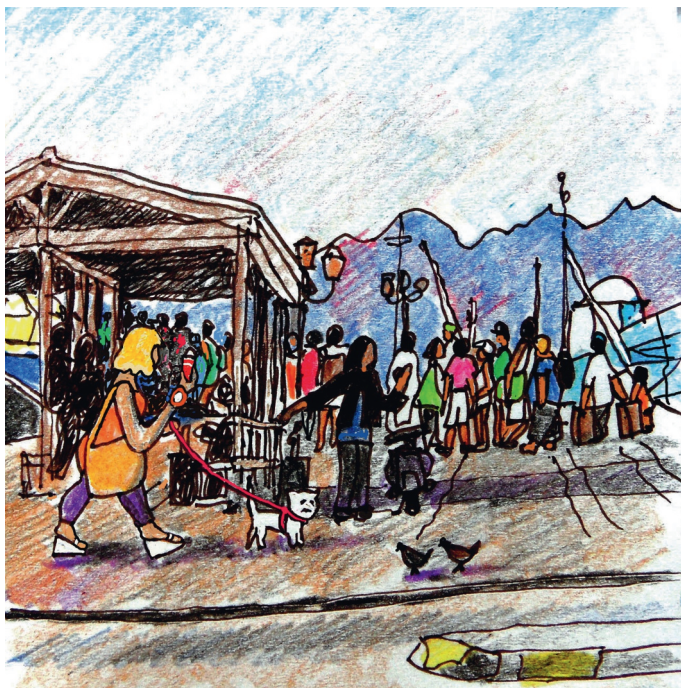
12 Σεπτεμβρίου, 9 πμ. Ο σκύλος νομίζει ότι να κάνει καλά ένα περιστέρι 12, 9:00. The small dog thinks that it will get a pigeon