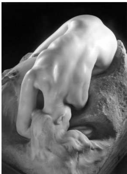
Danaë de Camille Claudel et Auguste Rodin. 3