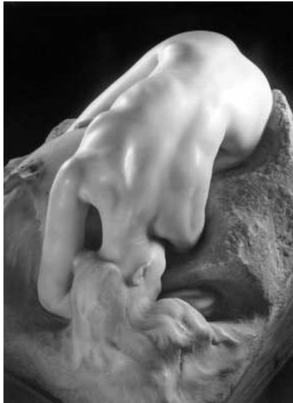
Danaë de Camille Claudel et Auguste Rodin. 3