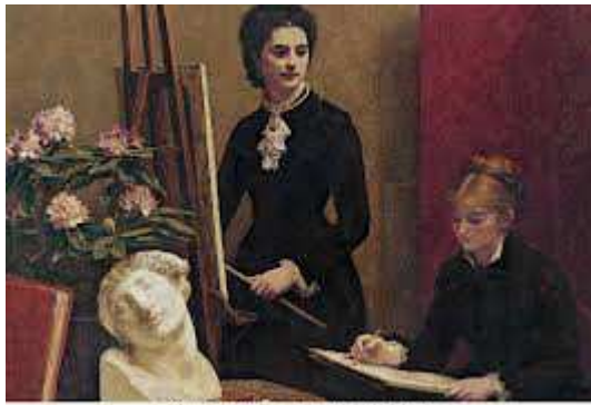
Un atelier au féminin du début de 1900.

Ce récit est pour toi, ma petite, puisque, si un jour quelqu'un va te dire que ta mère a été une dévergondée qui non seulement a eu une fille d'un homme qui n'était pas son mari mais qui a aussi sculpté des statues si scandaleuses à ne pas mériter une commande publique, tu lui répondras que souvent les apparences ne sont qu'une petite partie de la vérité et pas toujours la partie vraiment importante et décisive.