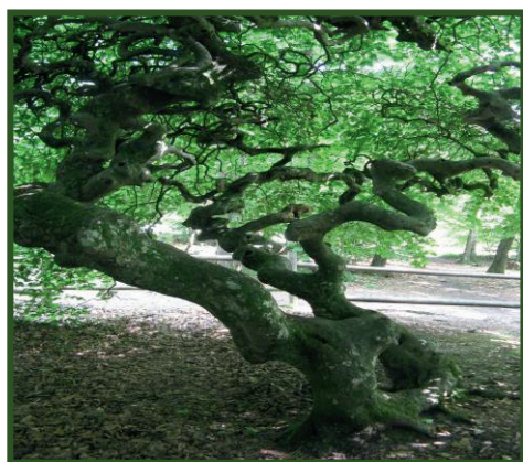
Fauz (Hêtre tortueux) de la Forêt de Verzy près de Reims

Le Hêtre apporte de la fraîcheur lors des chaudes journées d'été. Le bruissement de ses feuilles révèle une activité constante. La vie qui émane de l'intérieur de son tronc surgit avec intensité et s'élance dans l'éclosion de la renaissance, dès le tout début du printemps. Sa vitalité et sa fougue s'affirment au fil des saisons. Il donne de l'élan et affirme la volonté. Quand il a assez d'espace pour s'épanouir, cet arbre se révèle dans toute sa splendeur. Il rayonne et nous démontre que nous avons, nous aussi, des forces cachées.