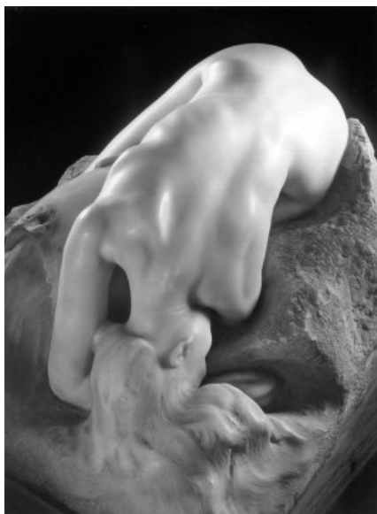
Danaë de Camille Claudel et Auguste Rodin. 3