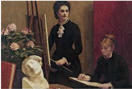
Henry Fautou-Latour / "La légende de Jeanne au Portofino" - oil on canvas, 1881 x 110 cm. Musée Royal des Beaux-Arts de Belgique, Brussels.

Ce récit est pour toi, ma petite, puisque, si un jour quelqu'un va te dire que ta mère a été une dévergondée qui non seulement a eu une fille d'un homme qui n'était pas son mari mais qui a aussi sculpté des statues si scandaleuses à ne pas mériter une commande publique, tu lui répondras que souvent les apparences ne sont qu'une petite partie de la vérité et pas toujours la partie vraiment importante et décisive.