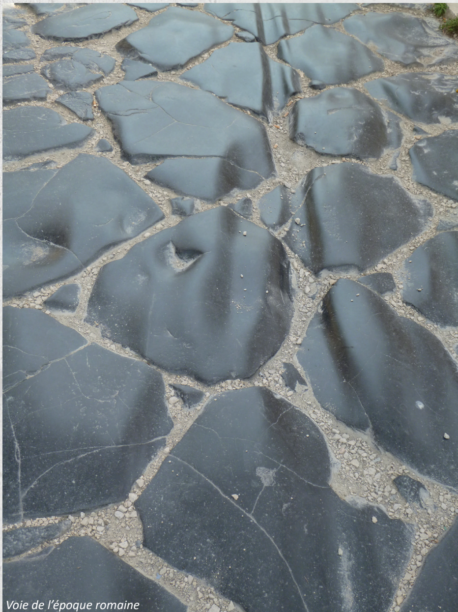
Voie de l'époque romaine

Pérenne, il est mémoire : il témoigne du passage des générations passées, présentes et futures.