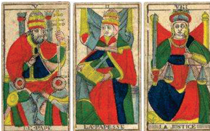
table des illustrations