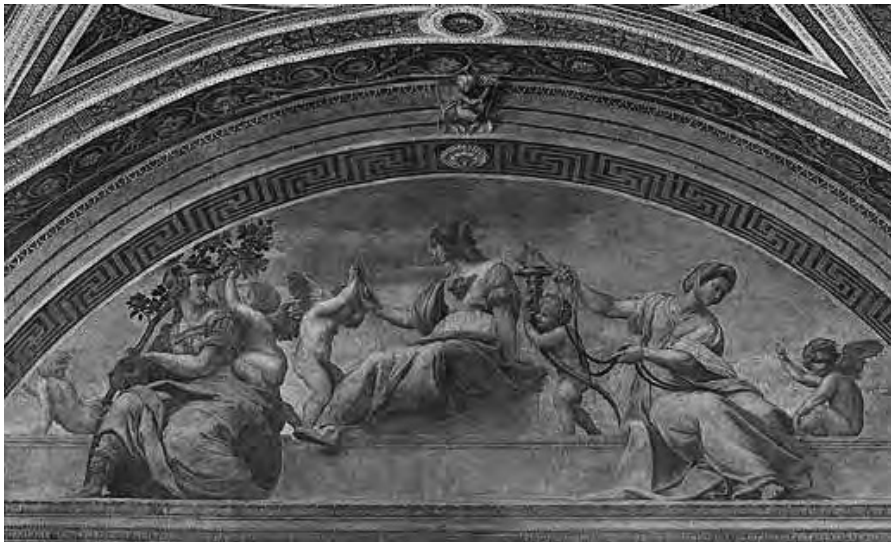
Les trois vertus cardinales : peinture de Raphaël

C'est un peu comme pour nous dire qu'au moment d'entamer le niveau 2, notre développement personnel, nous allons nous attaquer à des choses impalpables, invérifiables, non quantifiables.