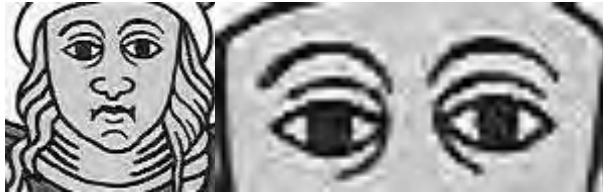
extrait de carte du tarot de Jodo/Camoin, Editions Camoin ©

Mais vraiment bien en face ! Au point de te prendre à la gorge !