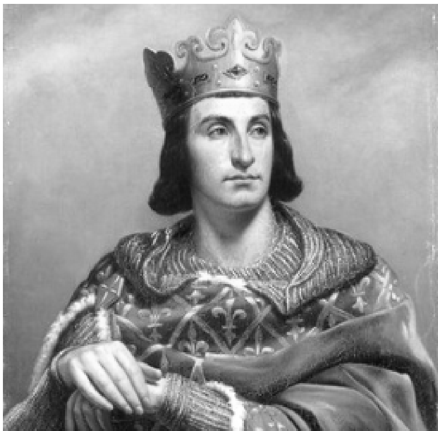
Portrait imaginaire de Philippe Auguste par Louis-Félix Amiel - XIX e siècle