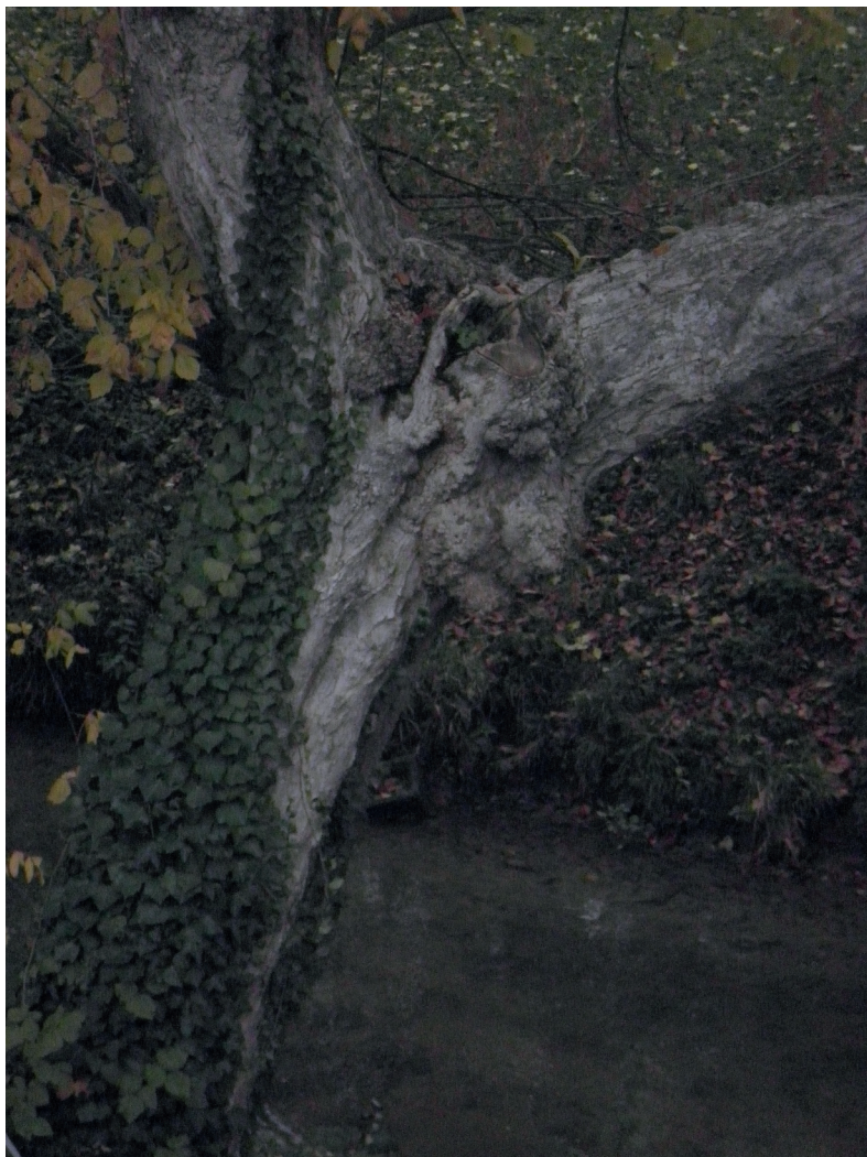
Bords de La fausse Rivière à Provins Arbre-Mâitre (2013) - Côté Rue du Dr Schweitzer - Abattu en 2015-