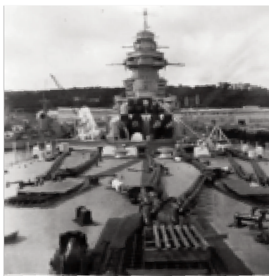
Vue du Richelieu de la Proue

Eh, oui, j'étais tombé du hamac. Heureusement j'avais en dessous de moi cinquante centimètres de hauteur. Mais les autres un mètre cinquante maximum ; car une rangée de placard était en dessous. Malgré cet incident j'ai bien dormi.