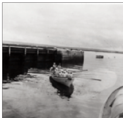
Première leçon d'aviron