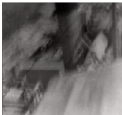
La cheminée du Centaure -