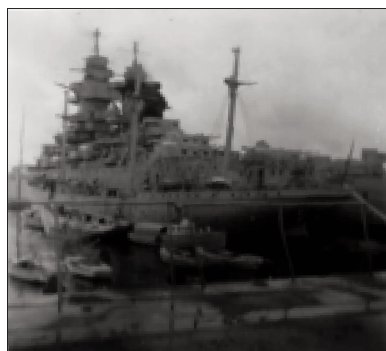
La Duchesse Anne accostée au Richelieu