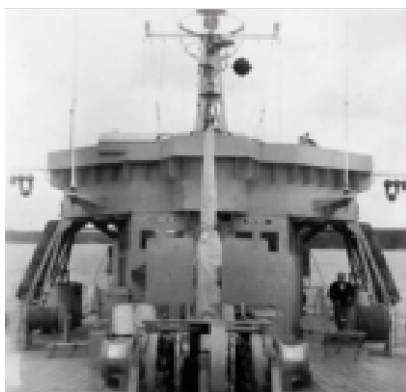
La cabine de la barre, la passerelle de commandement - vue de la proue du Centaure