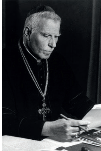
Clément August Von Galen (1878-1946)

Clément August Von Galen était un prêtre catholique allemand qui s'opposa aux nazis. Il dénonça notamment durant ses sermons la politique d'euthanasie mise en place par le régime, et la persécution de l'Eglise. Les nazis n'osèrent pas agir contre lui, par crainte de la réaction de la population.