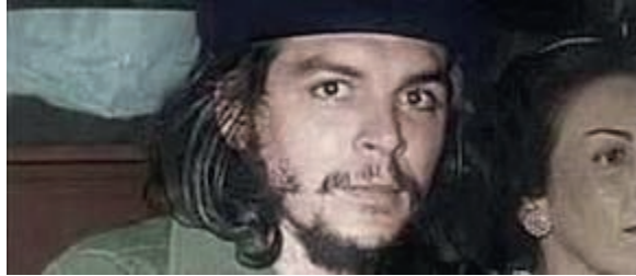
Che Guevara (1928-1967)

Le révolutionnaire argentin Che Guevara était médecin. Il fit ce choix pour soigner sa grand-mère malade et parce qu'il était atteint d'asthme chronique. Plus tard, il créa une ferme agro-médicinale à Cuba où il fit venir 162 paysans guérilleros pour leur apprendre à lire et à travailler la terre.