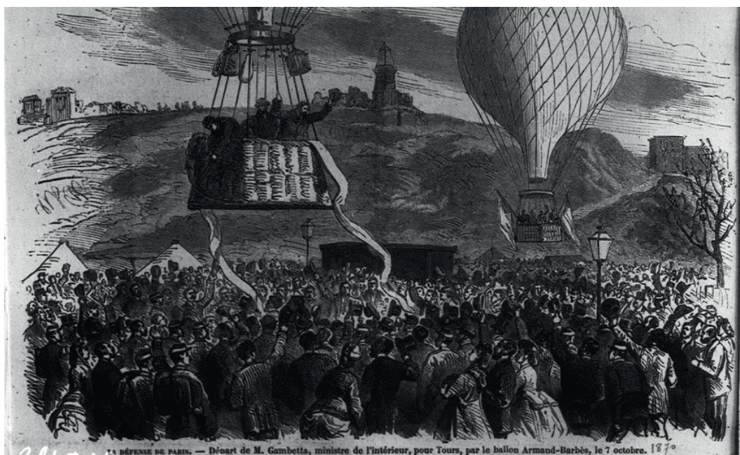
Départ de Gambetta en ballon

En 1870, Paris était encerclée par l'armée prussienne. Le jeune ministre de l'intérieur Léon Gambetta, opposé à la capitulation, décida de quitter la capitale en montgolfière, avec un assistant. Il réussit à rejoindre le gouvernement déplacé à Tours et à organiser une armée de contre-attaque.