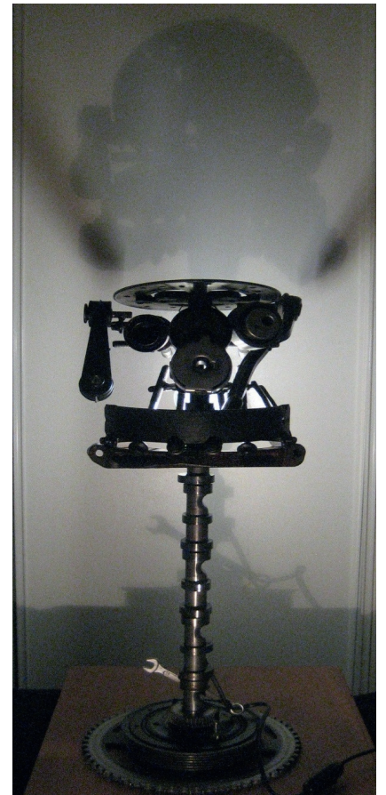
Australopithèque Lux 2018 9kg 70cm Pièces auto

De là, il regarda autour de lui. Partout, toujours, tous enviaient son confort et sa lumière.