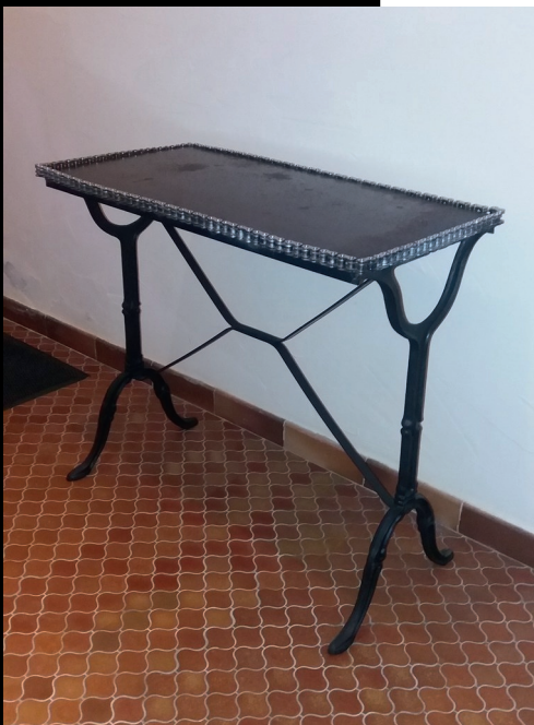
Table chaînes massive 2019 12kg 110 Cm Pieds de table, tôle, chaîne moto

Pour une poignée de clopinettes, vendit les recettes car bien meilleur inventeur que vendeur à jamais il serait