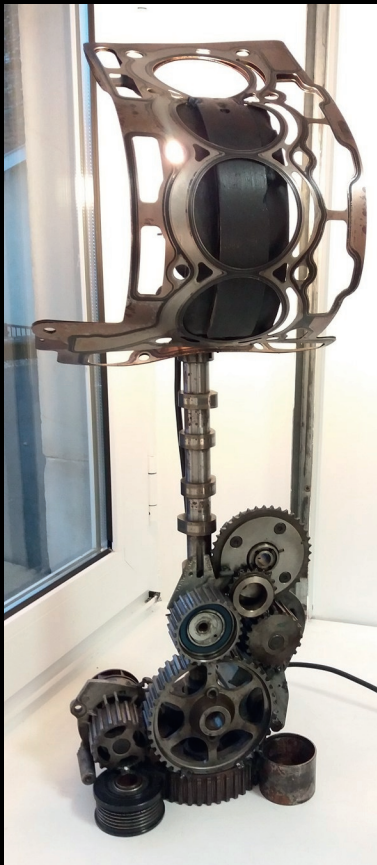
Temps moderne -2018 9kg 80cm Pièces auto

Il fut une époque éloignée où l'Homme n'en était pas encore un comme on le conçoit aujourd'hui. Sa femme non plus, d'ailleurs.