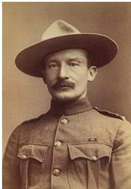
Baden Powell (1 857-1 941)

En 1907, un général à la retraite, Baden Powell, s'inspirant de son expérience au contact des jeunes, lors de la Seconde Guerre des Boers, crée un camp expérimental sur l'île de Brownsea, en Angleterre, avec seulement 20 garçons. Il y teste ses méthodes d'éducation et de formation de la jeunesse. Le succès est immédiat: le scoutisme était né. Celui-ci compte aujourd'hui près de 40 millions d'adhérents.