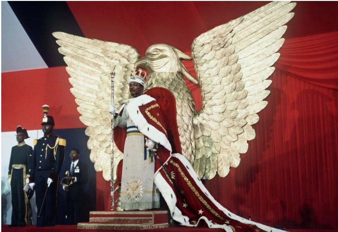
Jean- Bedel Bokassa couronné empereur, sous le nom de Bokassa Ier, le 4 décembre 1977

En décembre 1977, Jean-Bedel Bokassa, président de Centrafrique et dictateur sanguinaire, se couronna empereur à vie en essayant de reproduire le sacre de Napoléon Bonaparte: il fit sculpter un immense trône en forme d'aigle, porta un manteau d'hermine et organisa une réception pour ses 4000 invités calquée sur les traditions françaises. Celle-ci coûtera au pays la bagatelle de 20 millions de dollars.