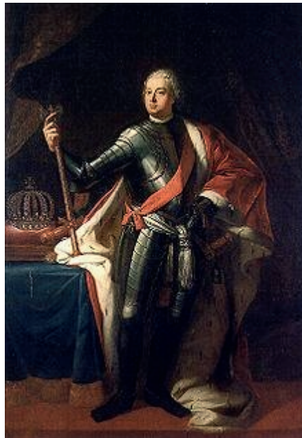
Frédéric-Guillaume Ier, roi de Prusse de 1713 à 1740

Frédéric-Guillaume Ier de Prusse (1688-1740) gouverna la Prusse comme une armée, à tel point qu'on le nommait « le roi sergent ». Dans sa volonté de conquête, il imagina une armée de géants: la taille minimale pour y rentrer était de 1m88 ; ce qui était immense pour l'époque. Il chercha même à recruter de grandes femmes pour obtenir des enfants de ces géants qui deviendraient eux-mêmes des soldats géants.