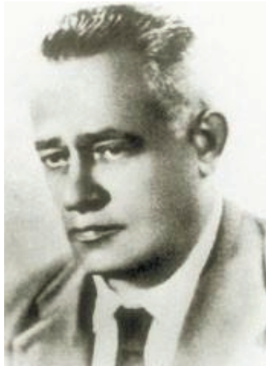
Pietro Ferrero (1898-1950)

Le Nutella fut inventé par Pietro Ferrero au lendemain de la Seconde Guerre mondiale. L'idée de mélanger des noisettes au chocolat vient de la situation d'après-guerre, où la fève de cacao était une denrée rare et onéreuse. Comme les noisettes étaient abondantes à proximité de chez lui, dans les collines du Piémont, il remplaça une partie du cacao par des noisettes.