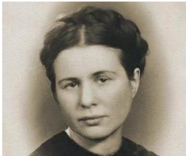
Irena Sendler (1 910- 2008)

Elle nota les identités des enfants ainsi que leur nouvelle fausse identité afin qu'ils puissent tenter de retrouver leurs parents après la guerre.