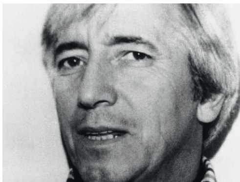
Georgi Markov (1 929-1 978)

Un « parapluie bulgare » au musée international de l'espionnage de Washington (États-Unis).