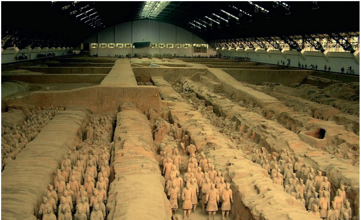
Les 8 000 statues