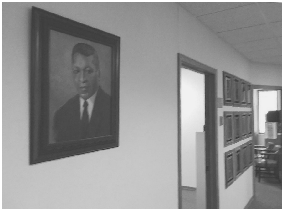
John Birch Society à Appleton, Wisconsin - www.seemorefacts.com .