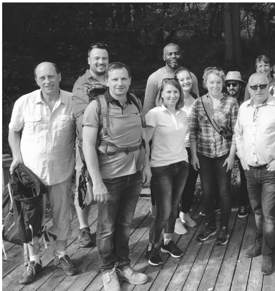
Avant la ... COVID