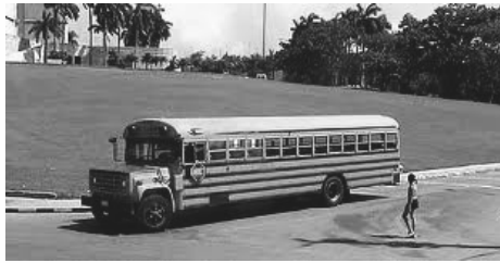
Le bus des quatre filles de Dieu

reviennent, recommencer à chaque fois, qu'elles ont relâcher depuis quelque temps.