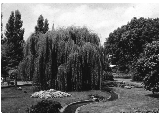
Le jardin public des années 1960.