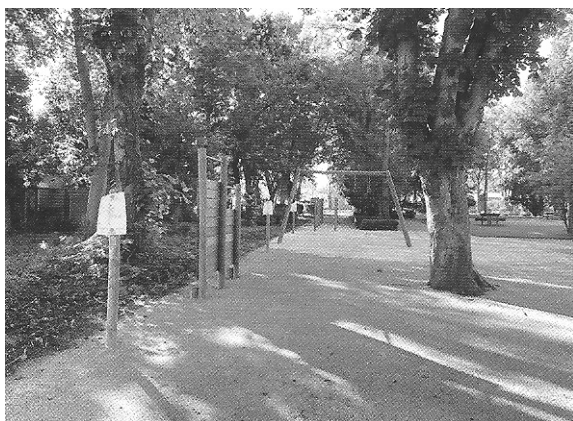
Le jardin en 2021.