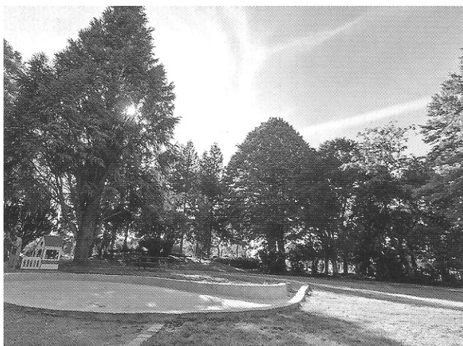
Le bassin d'eau en 2021.

Inauguré par le groupe béthunois " Jacks and Pallas ", jouant pendant près de deux heures devant un public ravi.