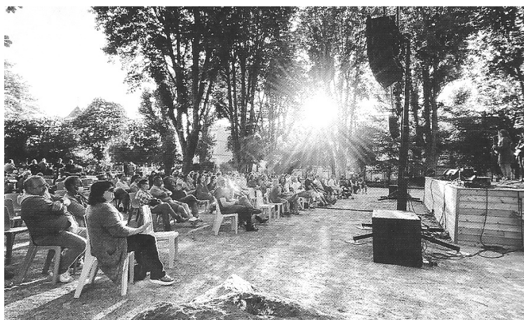
Première Fête de la musique dans le jardin le 12 juin 2021.