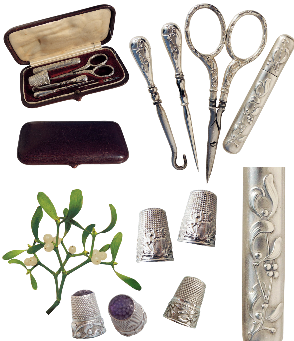
Nécessaire de couture en argent, fin XIX e . Il comprend une paire de ciseaux, un étui à aiguilles, un poinçon de couture, une aiguille passe-lacet et un tire-lacet. En bas: dé en argent avec calotte.

Autrefois, chez les Celtes, le gui était une plante sacrée censée guérir tous les maux. Poussant sur les arbres, le gui est en relation avec le ciel et donc avec le divin. Il représente la semence du chêne et symbolise la fertilité et l'immortalité.