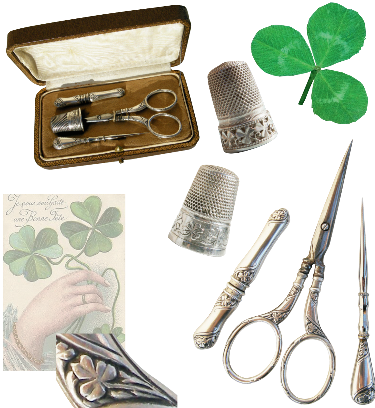
Carte postale ancienne. Nécessaire de couture en argent à décors de trèfles. Dé à coudre illustré de trèfles à quatre feuilles.

Cette illustration se répandit dans toute l'Irlande, et le trèfle fut ainsi associé à saint Patrick, puis à l'Irlande.