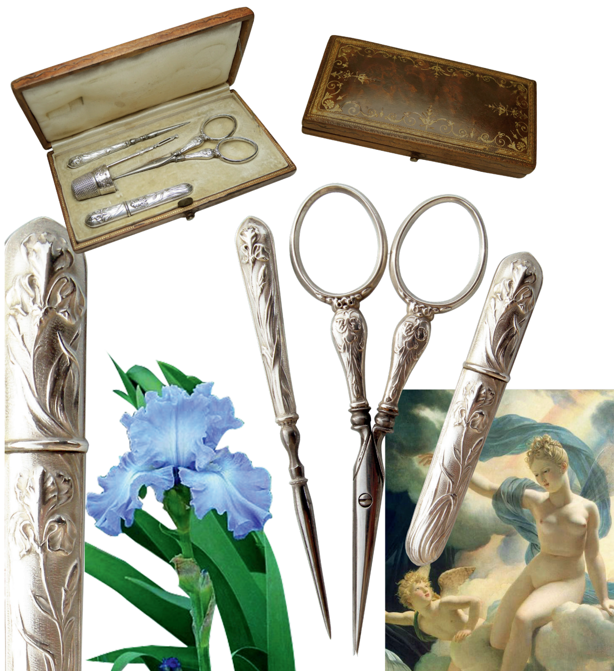
Nécessaire de couture en argent dans un coffret en cuir doré au petit fer. En bas à droite : peinture de Pierre-Narcisse Guérin 1811 représentant la déesse Iris.

Elle prévient les mortels de la fin des tempêtes, causées par ses sœurs les Harpies. Les Grecs anciens comparaient l'arc-en-ciel aux robes fluides et multicolores d'Iris.