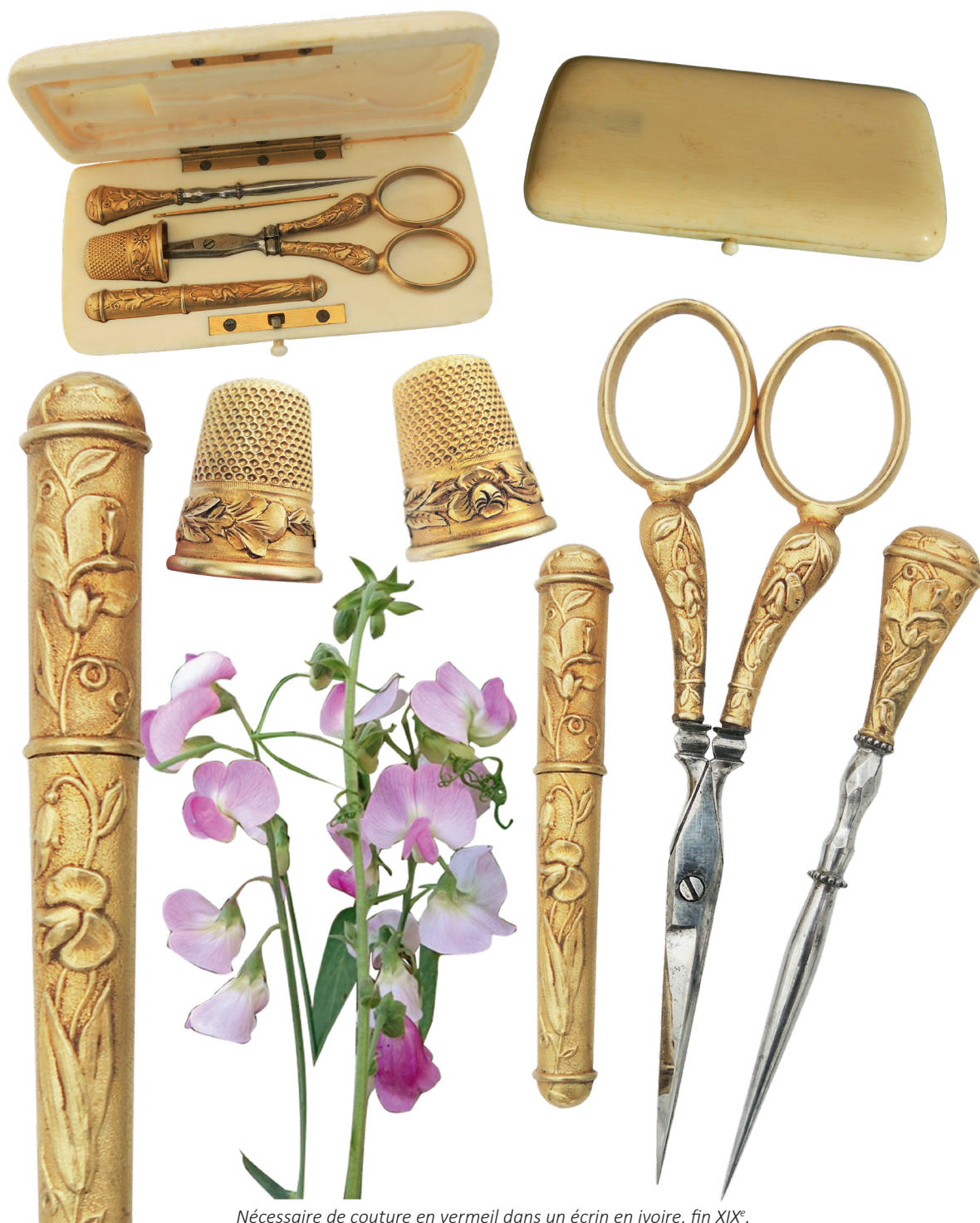
Nécessaire de couture en vermeil dans un écrin en ivoire, fin XIX e .

Dans la symbolique, le pois de senteur peut exprimer un questionnement envers son destinataire : « Mon amour pour vous est-il partagé ? ».