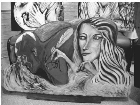
Le Verseau Création de l'auteur