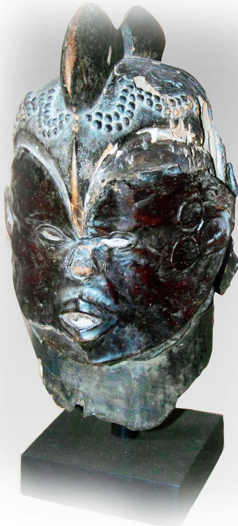
Masque heaume Ekoil Janus Nigéria