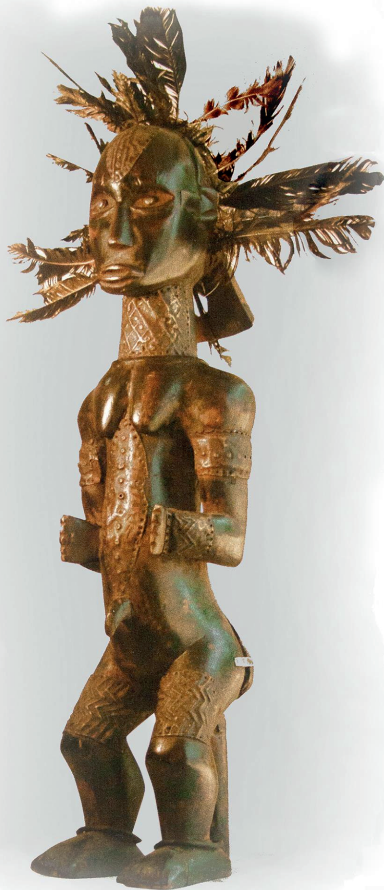
Statue reliquaire Okak Fang - Gabon