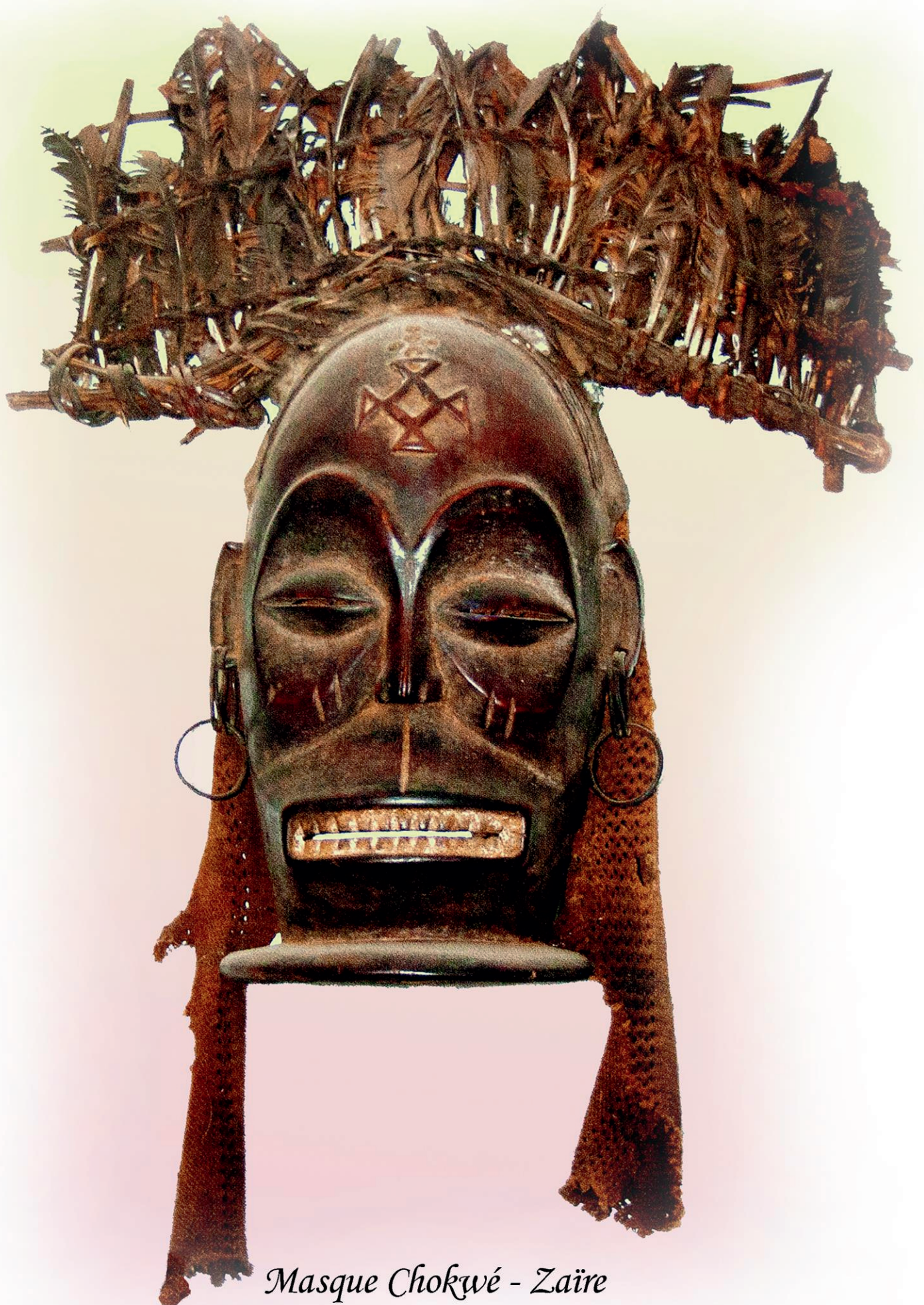
Masque Chokwé - Zaïre