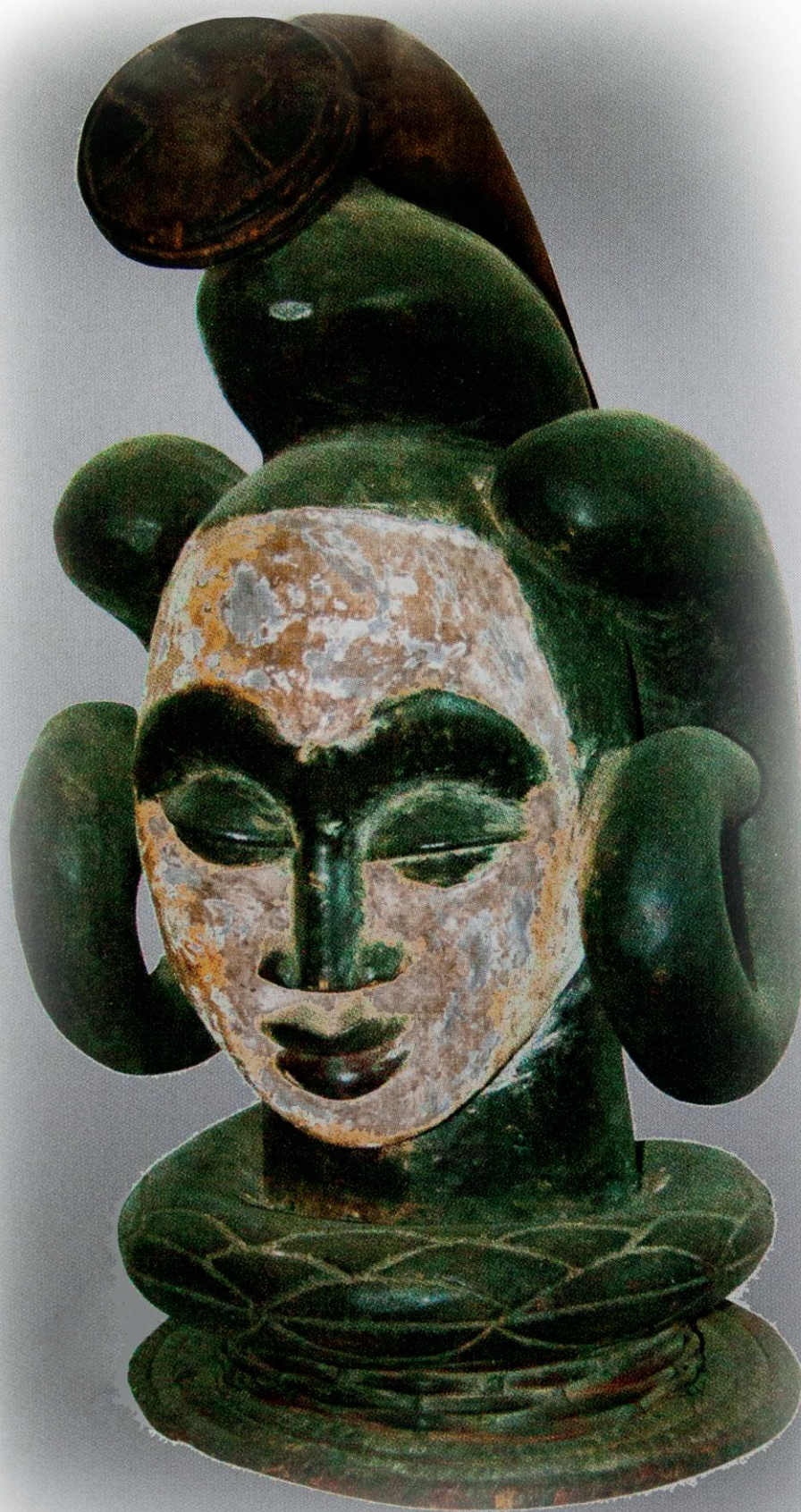
Statue en bois Fang - Gabon