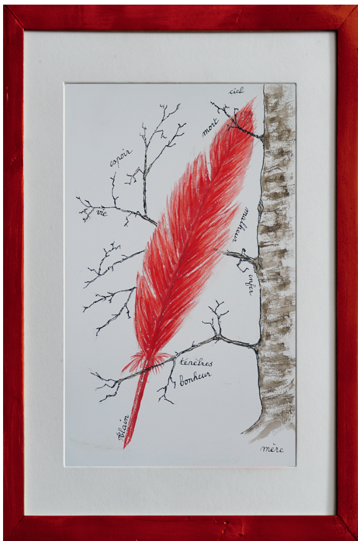
« Plume de vie » Par Alain Poncin