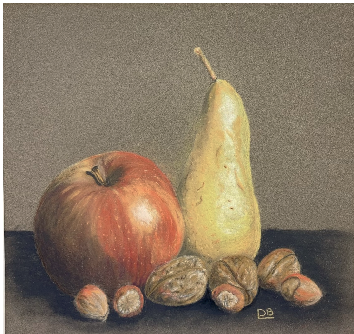
Fruits à croquer