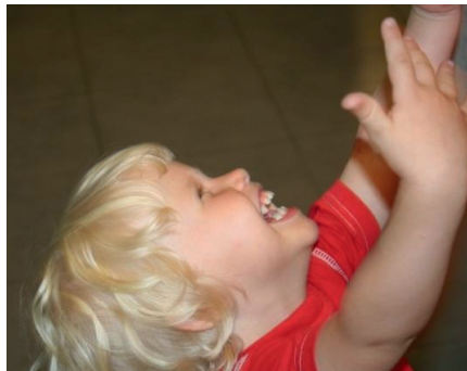
L'enfant cherche avant tout la relation affective avec le proche présent.

Il nous invite simplement à garder les qualités de relation que le Créateur a mises en chacun de nous, au départ de la vie, afin de tout pouvoir partager dans une Alliance d'amour et de croissance infinie.