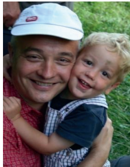
Se sachant aimé, l'enfant cherche à découvrir le réel avec tendresse.

Les grands jouent selon les règles, le petit, lui, met en jeu tout son cœur.