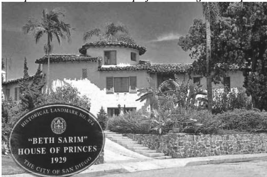
Une maison de princes pour les vacances de Rutherford ...

En rapport avec notre thème, nous notons que cette prise de position montre le caractère dictatorial de Rutherford, capable de donner des ordres et de proférer des menaces à un des plus terribles dictateurs... Hitler ! »