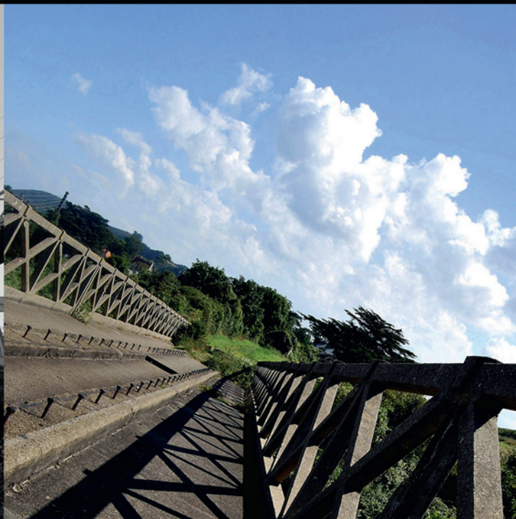
ERQUY, CÔTES D'ARMOR (22)